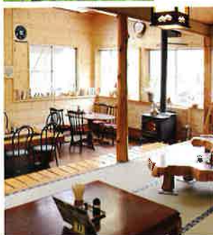
食堂内と薪ストーブ

広場にはハンモックやボール遊びなど、自由に遊べるスペースがあります。ご家族やグループに限らず、お一人様でも一日中楽しめる魅力あふれる空間です。