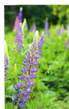
四季折々楽しめる草花が沢山