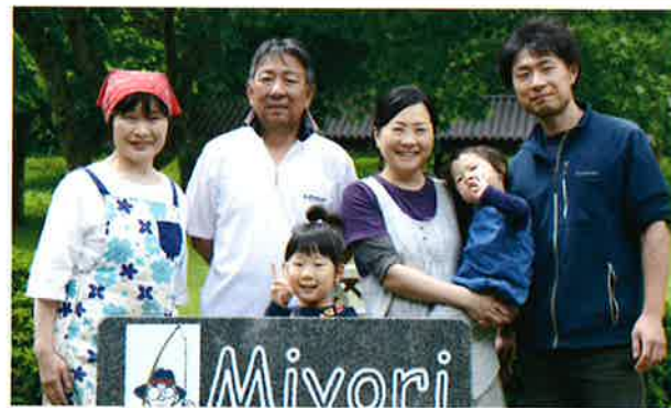
貸し竿・釣りエサ・お食事処・バーベキュー広場・駐車場完備(大型バス可能)

■営業期間/3月21日～11月30日 ■営業時間/午前7時～午後4時30分 (釣りの受付は午後2時まで)