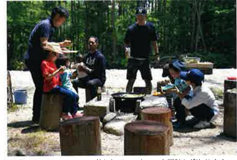
釣りとおバーベキューを同時に楽しめます