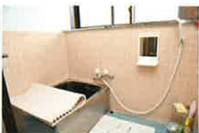
シャワー付のお風呂