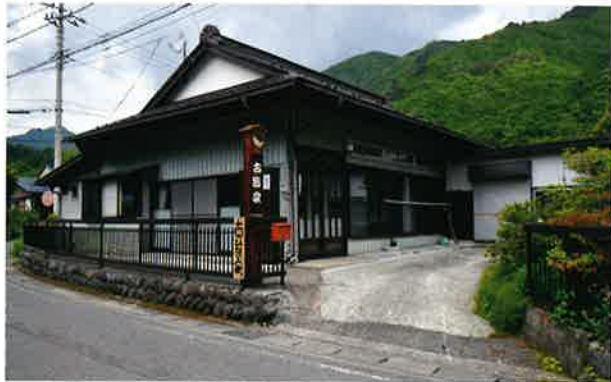
自然に囲まれた築65年の一軒家